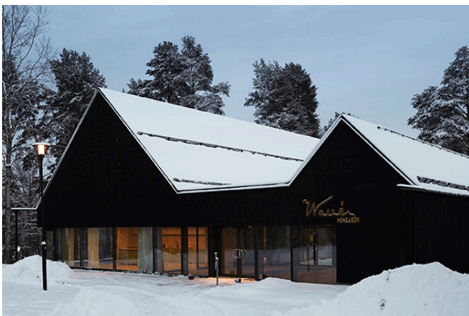
Wallénhallen

Långsiktighet: Genom projektet har grunden lagts för att skapa ett aktivitetshus i Wallénhallen som kan användas av många under många år.