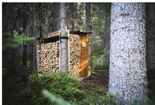
Art Run och Residens Stångtjärn. Konstnär: Kristin Ylikiiskilä Broberg.

Projektet i Dalarna involverade 16 st aktivt anlitade konstnärer / kulturutövare och nådde minst 500 besökare.