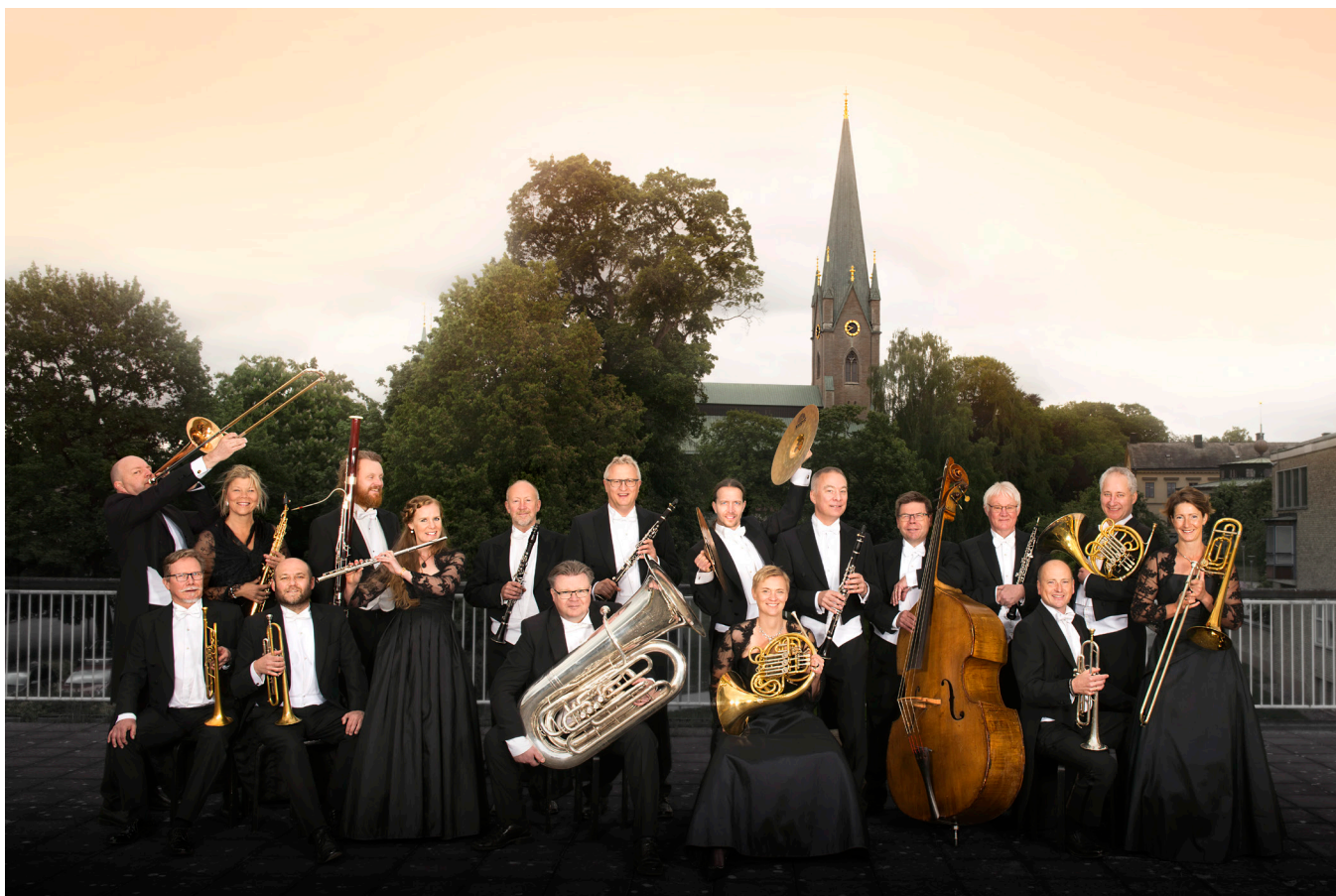
Östgötamusiken. Östgöta Blåsarsymfoniker.

Musikerna formeras vanligtvis i tre ensembler: Östgöta brasskvintett, Östgötabandet (jazzensemble) och Crusellkvintetten (blåskvintett). Man framträder också i orkester, då ofta med komplement av tre orkestermusiker, i Östgöta Blåsarsymfoniker.