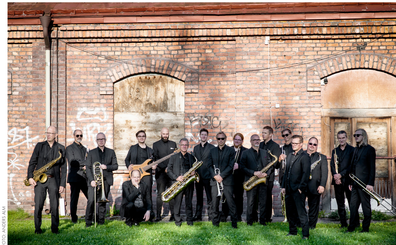
Norrbottensmusiken. Norrbotten Big Band.