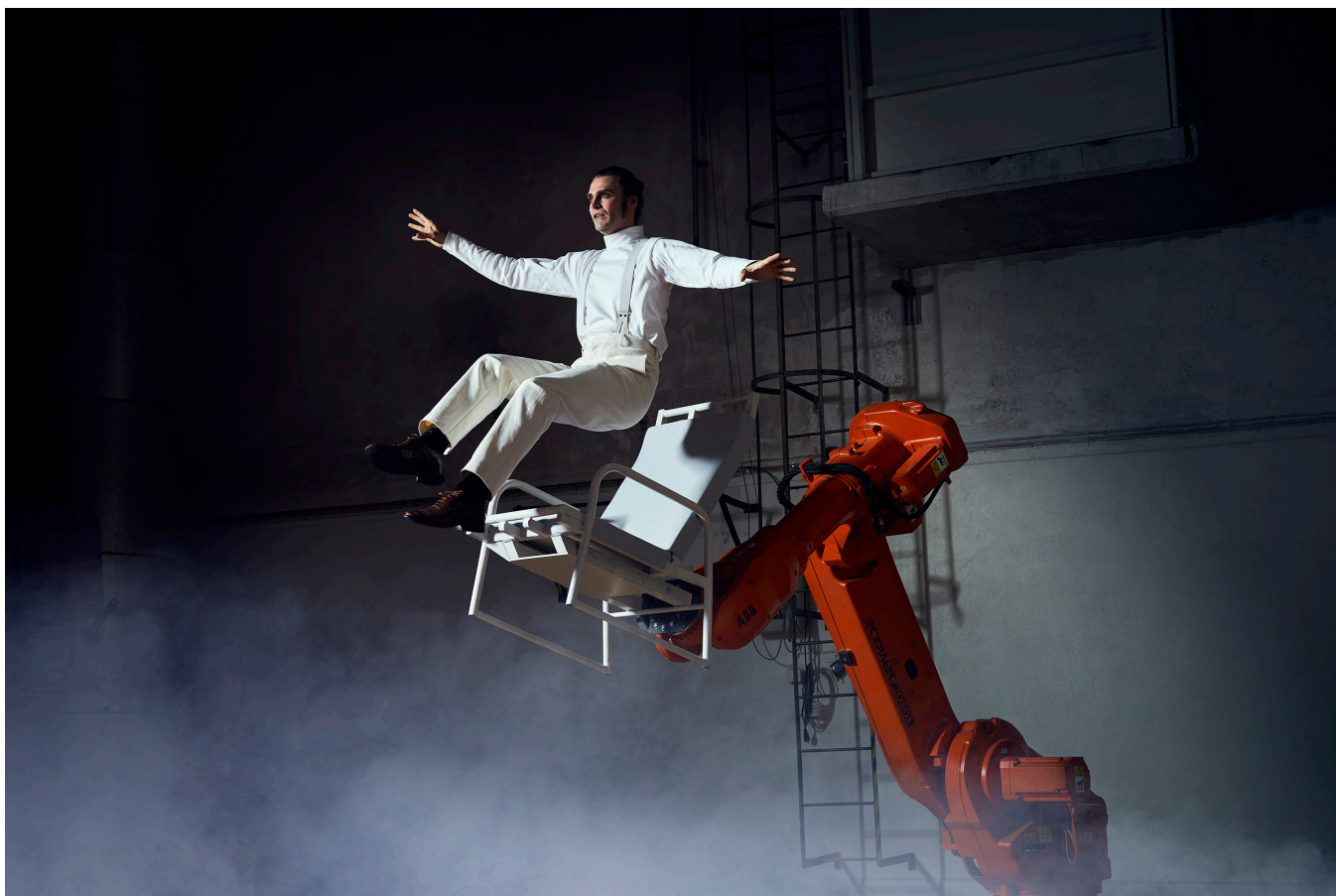
Scenkonst Öst. Östgötateatern, The last fish (2019–2020).

samma sätt: Produktionen sker i Norrköping. Sedan är det premiär, antingen i Norrköping eller i Linköping. Detta delas mellan städerna. Något liknande teatersamarbete mellan två jämbördiga städer finns inte någon annanstans i Sverige.