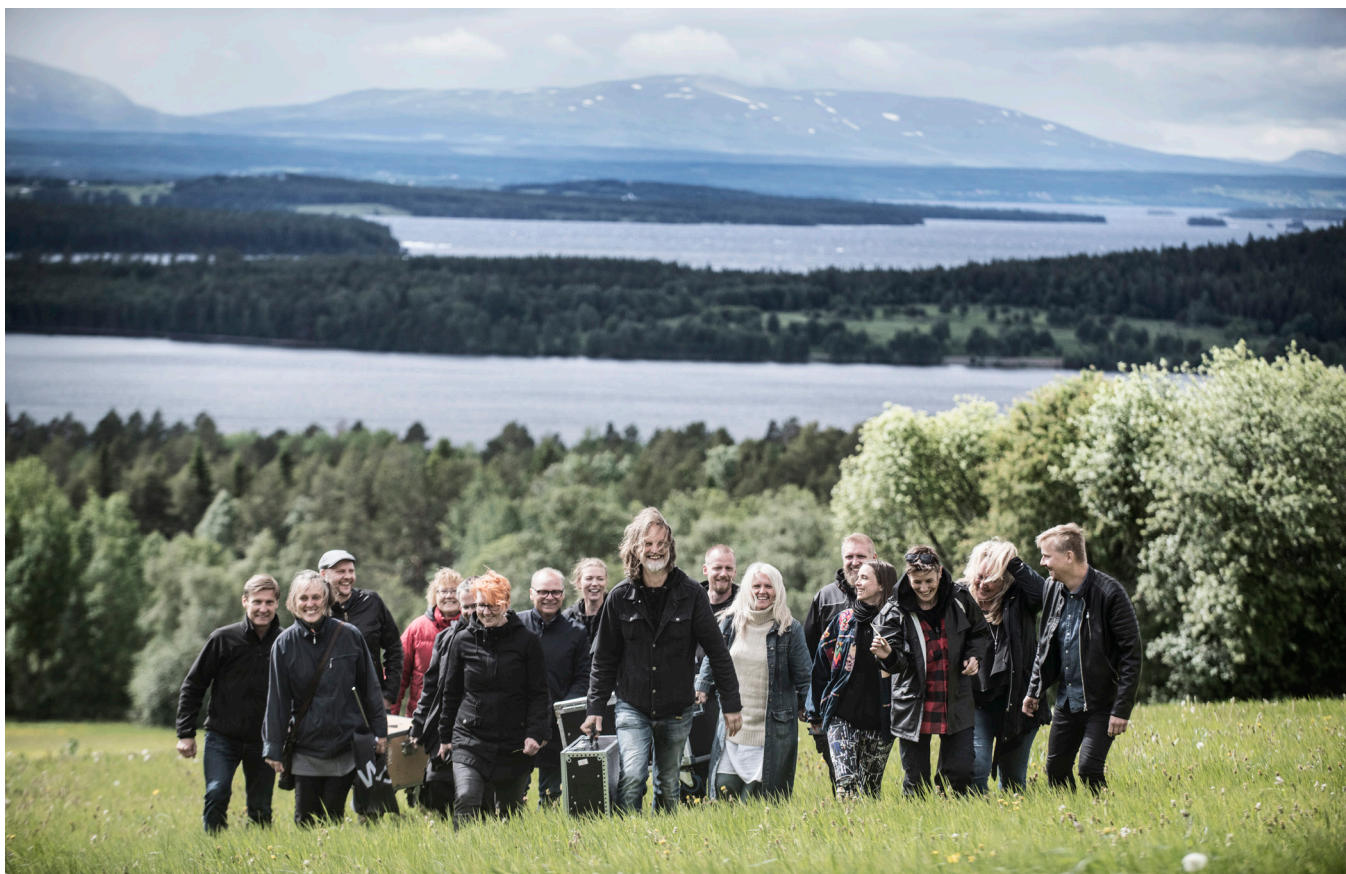
Estrad Norrs personal. Inget eget hus. Alltid på turné.