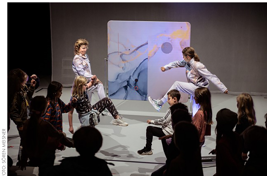
Dansstationen. Hela sanningen (2020).

Till de stora frågorna för framtiden hör det samarbets- och produktionsavtal med Malmö Opera som är under förhandling. Vidare strävar Skånes Dans-teater efter att göra fler turnéer och att utveckla lokalerna för att kunna ta emot fler produktioner från den fria sektorn.