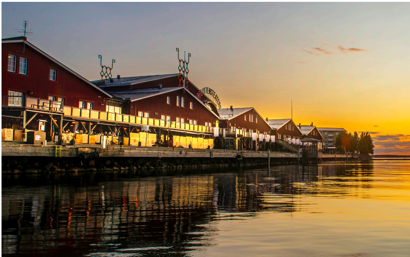
Norrbottensteatern (ark. Hans Tirsén, 1986).

Norrbottensteatern producerar teater och köper in gästspel. Produktionen för yngre publik skapas av Ung scen norr, som sedan 2018 är en del av den ordinarie verksamheten. Ung scen norr har en producent och en dramapedagog, som bl.a. arbetar med Riksteaterns projekt Länk, som tar fram nyskriven dramatik för skolor och unga amatörenssembler.