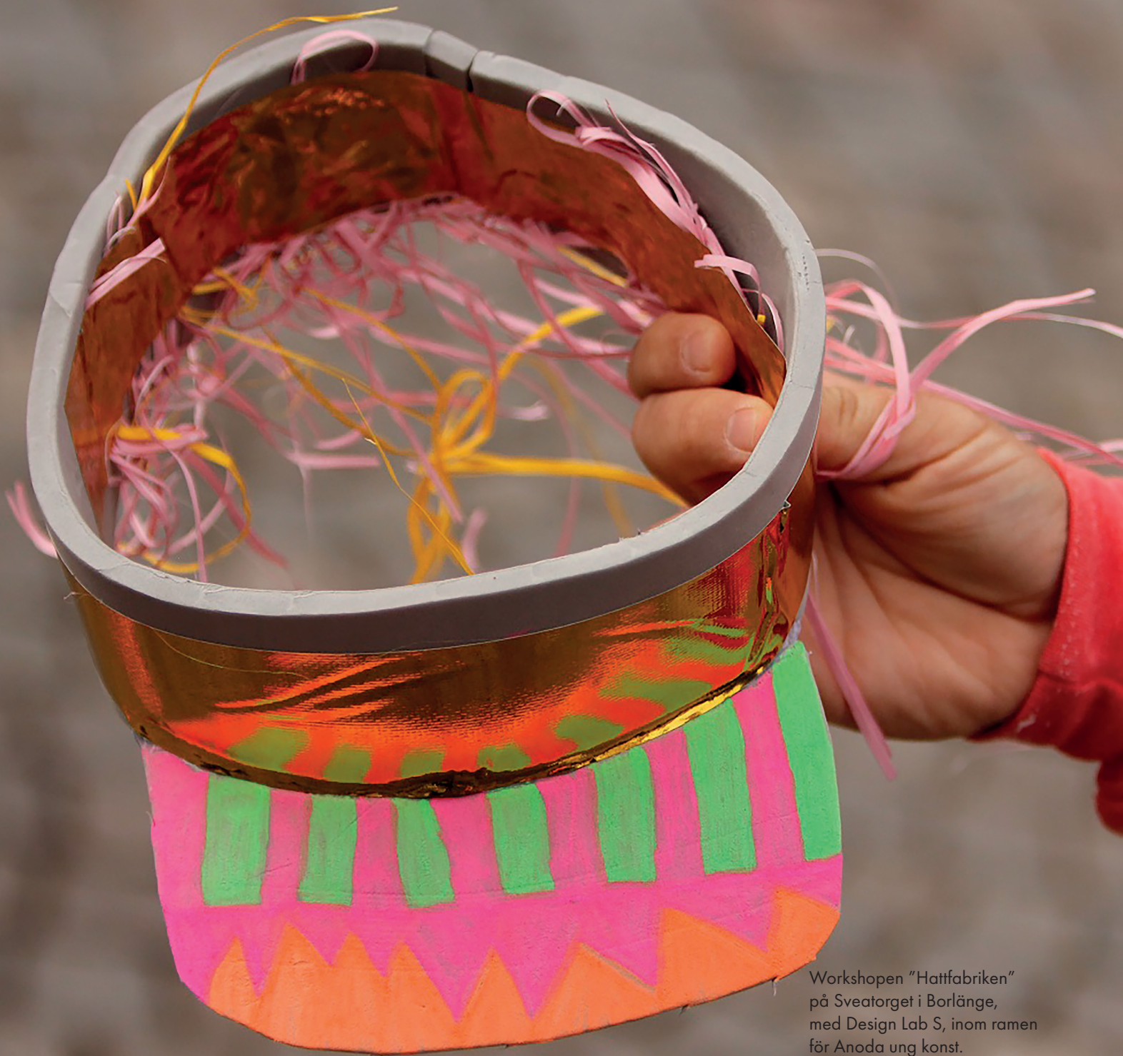
Workshopen "Hattfabriken" på Sveatorget i Borlänge, med Design Lab S, inom ramen för Anoda ung konst.