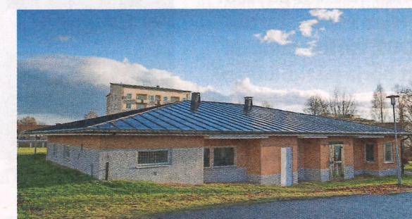
Rester. När höghus revs på Malmgatan sparades husets botten och är nu tvättstuga och bibliotek.